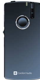
Comfort Digisystem Microphone DM10