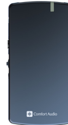
Comfort Digisystem Receiver DE10 och Receiver DH10