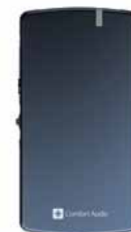
Barnet med nedsatt hörsel bär mottagaren Handset DH-10 i en hals slinga.

Läs mer i våra produktblad som du kan ladda ner på www.comfortaudio.se