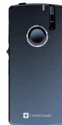
Sändaren Microphone DM-10 kan även kopplas till andra ljudkällor som till exempel DVD eller dator.

I Comfort Digisystem ingår ett flertal olika sändare och mottagare. Här nedan ser du ett urval av våra produkter för förskolan.